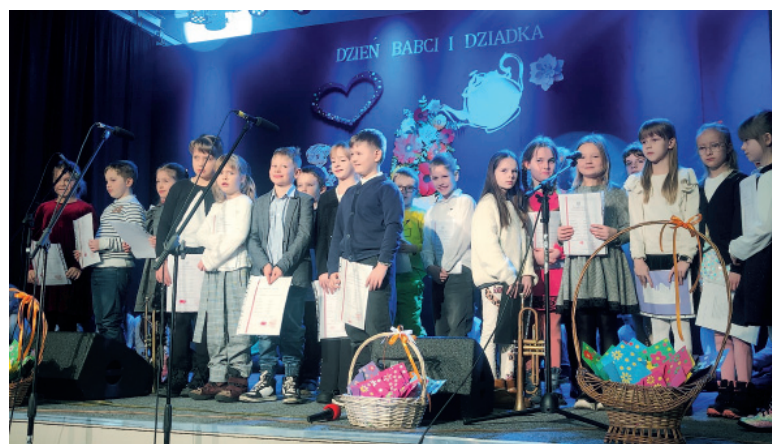
Dzień Babci i Dziadka

Szkolne świętowanie Dnia Babci i Dziadka w BDK w Sośnie było czasem wzruszeń i wspomnień. Klasa trzecia zaprezentowała montaż słowno-muzyczny „Jak babcia dziadka poznała”. Uczniowie w ciekawy i humorystyczny sposób przypomnieli najwię-