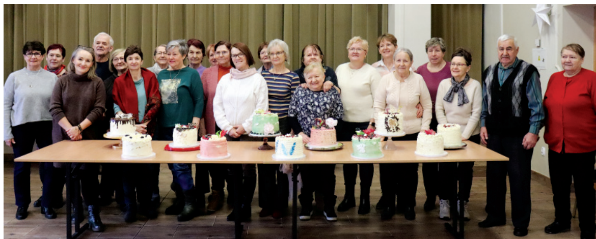
Klub seniora podczas dekoracji tortów