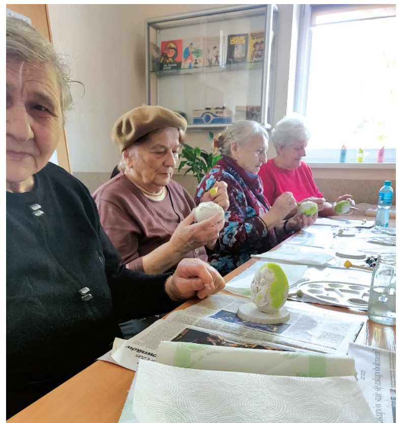
Panie seniorki podczas pracy

w wydarzeniach kulturalnych i spotkaniach rozwijających zainteresowania czytelnicze.