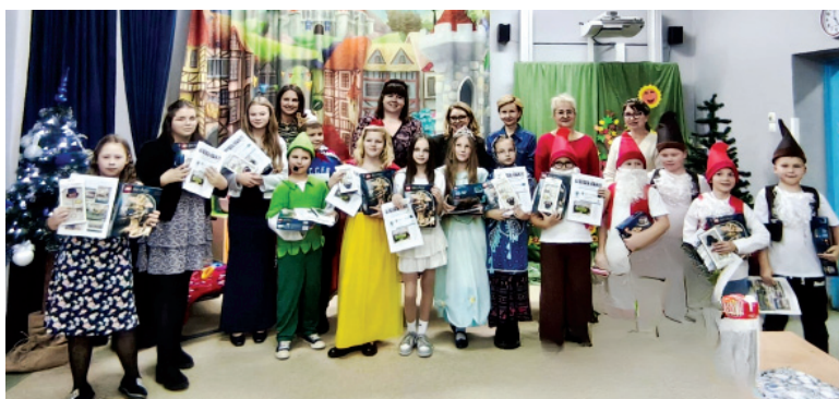
Finał konkursu Odblaskowa szkoła

W marcu nie zapomnieliśmy o Międzynarodowym Dniu Języka Ojczystego, który upłynął pod znakiem potyczek językowych i celebrazji języka ojczystego. Apel zorganizowany z tej okazji, a kilka dni wcześniej konkursy: pięknego pisania, ortografii, znajomości nowych zasad ortografii polskiej, angażowały wszystkich uczniów, mieli oni okazję sprawdzić swoją wiedzę z