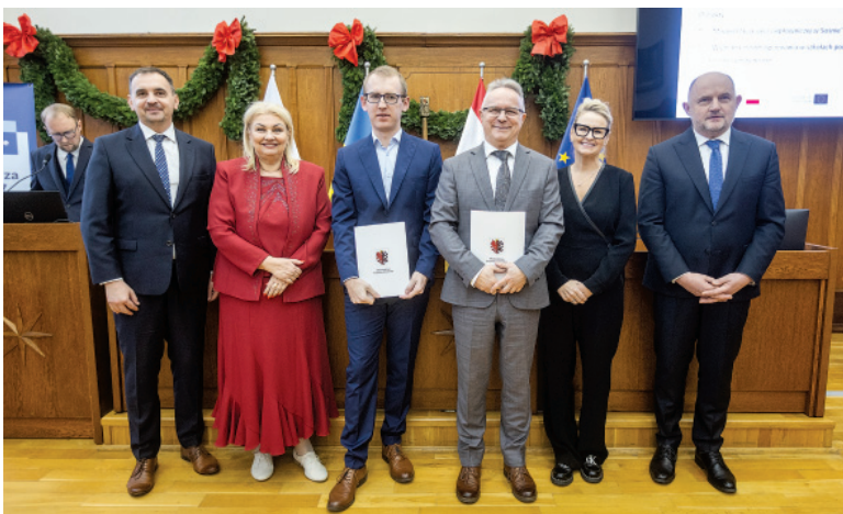
Podpisanie umów o dofinansowanie

Gmina Sośno pozyskała ponad 3,2 mln zł dofinansowania z programu Fundusze Europejskie dla Kujaw i Pomorza na realizację inwestycji związanych z poprawą efektywności energetycznej. Środki zostaną przeznaczone na modernizację sieci ciepłowniczej w Sośnie oraz unowocześnienie systemów ogrzewania w szkołach podstawowych. Prace w obszarze gminnej sieci ciepłowniczej obejmą wymianę wyeksploatowanej infrastruktury na nowoczesną sieć wyko-