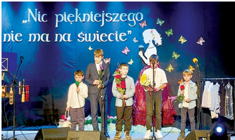
Aktorzy z Teatru „Rekwizyt” składają paniom życzenia

Wypełniona po brzegi sala Biblioteki Domu Kultury w Sośnie pokazała, że Dzień Kobiet wciąż pozostaje jednym z najpiękniejszych świąt w kalendarzu. Spotkanie zorganizowane przez wójta gminy Sośno, Stowarzyszenie Kobiet „Serca Wsi” oraz BDK odbyło się w serdecznej i radosnej atmosferze.