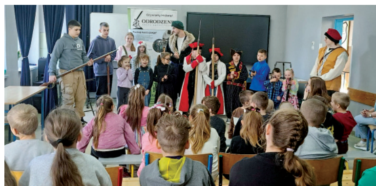
Pokaz historyczny Odrodzenie