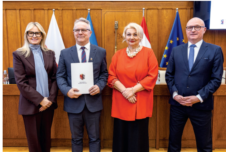
Podpisanie umowy na dofinansowanie

Dwie ważne inicjatywy edukacyjne będą realizowane na terenie gminy Sośno dzięki środkom z programu Fundusze Europejskie dla Kujaw i Pomorza. Projekty obejmą zarówno uczniów szkół podstawowych, jak i najmłodsze dzieci w wieku przedszkolnym, a także nauczycieli i rodziców. Pierwszy z projektów, pn. „Podniesienie kompetencji kluczowych uczniów w Gminie Sośno”, skierowany jest do 350 uczniów z trzech szkół podstawowych: w Przepalkowie, Sośnie oraz Wąwelnie. Wśród uczestników znajdzie się 173 dziewczęta i 177