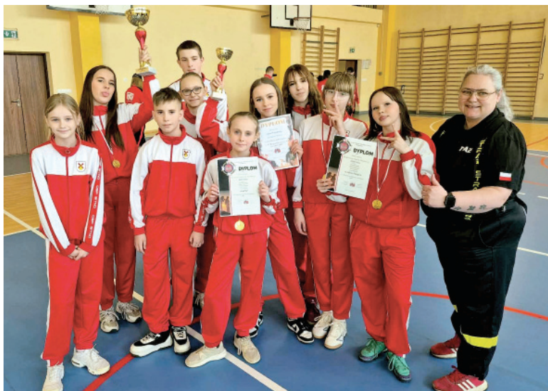
Młodzieżowa Drużyna Pożarnicza w Sitnie