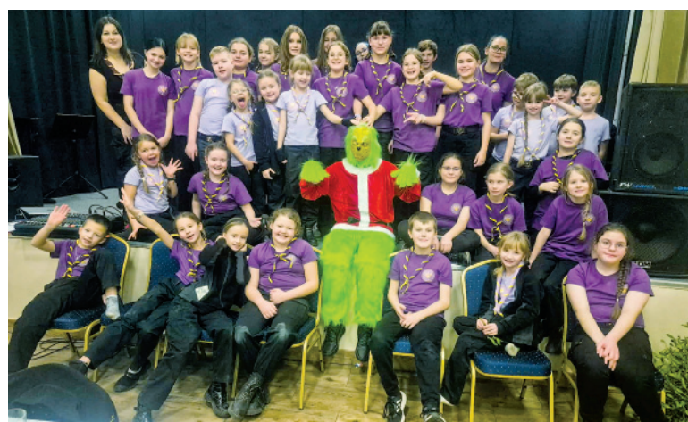
Zuchy i harcerze - wszyscy razem

conej takim wydarzeniom jak: uchwalenie Konstytucji 3 maja, powstanie kościuszkowskie, powstanie listopadowe i styczniowe. Rekonstruktorzy z grupy „Odrodzeni” w sposób przystępny opowiedzieli o przyczynach, przebiegu oraz znaczeniu tych wydarzeń dla losów naszego kraju.